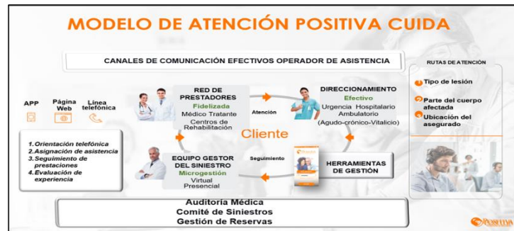
Figura 1. Modelo de Atención Positiva Cuida 2019

El modelo de atención integral del siniestro POSITIVA CUIDA, se define como el Programa que en forma ágil, confiable, dinámica y eficiente asiste a los afiliados y/o asegurados y empresas de manera especializada ante la ocurrencia de un siniestro, identifica de forma oportuna al siniestrado y garantizando la atención médica requerida, realiza diferentes procesos de auditoría médica que permiten el seguimiento integral de los casos y el cumplimiento de la promesa de valor realizada a nuestros afiliados y/o asegurados.