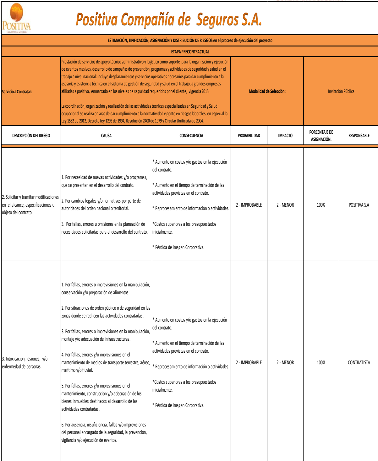
Matriz de Riesgos Operativos: Parte 2 de 3